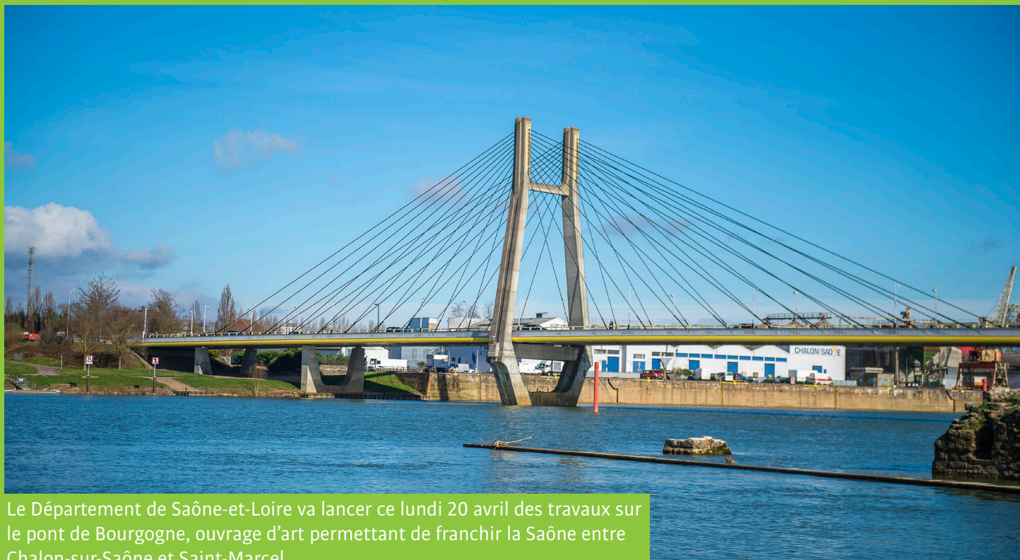
Le Département de Saône-et-Loire va lancer ce lundi 20 avril des travaux sur le pont de Bourgogne, ouvrage d'art permettant de franchir la Saône entre Chalon-sur-Saône et Saint-Marcel.