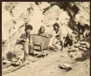
Dégagement des galeries

Depuis 1963, des passionnés se sont investis sans réserve dans la découverte du réseau souterrain. Ils mettent au jour les traces d'activité de l'Homme et des animaux préhistoriques et les offrent à la curiosité du public.