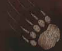
Cèdres bicentennaires classés

Aujourd'hui, la grotte abrite plusieurs espèces de petits mammifères terrestres et d'animaux aquatiques cavernicoles.