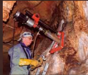
Carottage pour datation

Avec la même passion, des spéléologues et des scientifiques continuent d'explorer la grotte animés par la même soif de comprendre notre passé et notre environnement naturel.