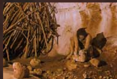
Habitat de l'Homo erectus

Depuis le Paléolithique inférieur (env. 350 000 ans), la grotte préhistorique a souvent servi de refuge aux hommes.