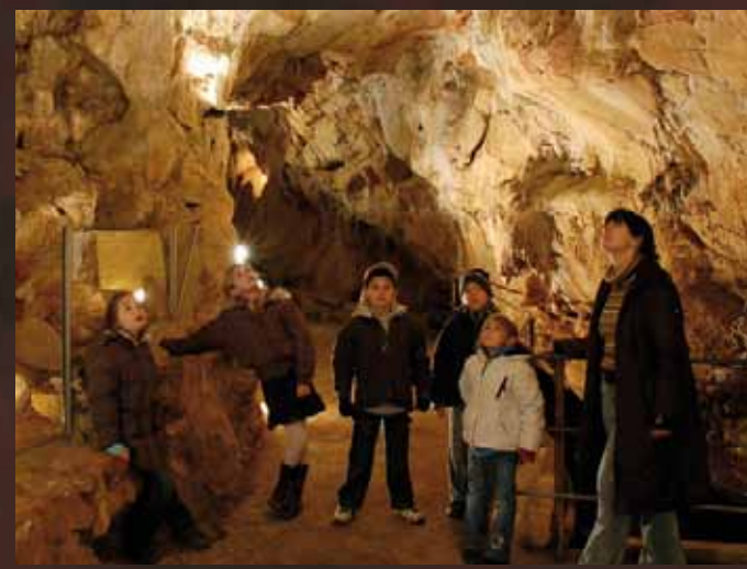
Visite d'un groupe scolaire