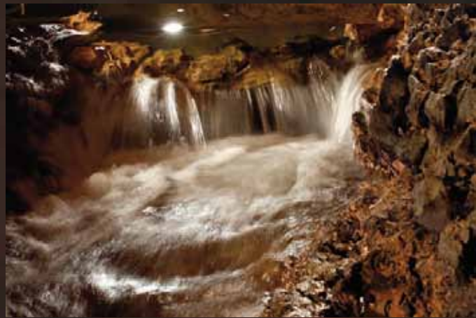
Cascade de la rivière souterraine

La rivière souterraine sculpte inlassablement la roche pour offrir un spectacle féerique.