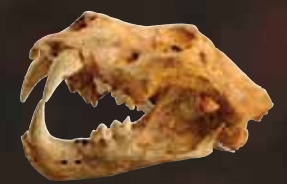
Lion des cavernes