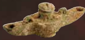
Lampe à huile romaine