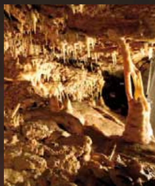
Stalactites et stalagmites