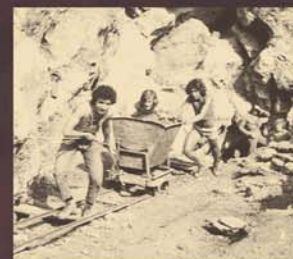
Uitgraving van de galerijen

Sinds 1963 hebben liefhebbers zich voortdurend ingezet om het ondergronds netwerk bloot te leggen. Ze laten sporen zien van mensen en prehistorische dieren die het publiek kan bewonderen.