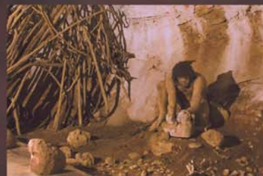
Woning van de homo erectus

Sinds de vroege prehistorie (paleo, ongeveer 350.000 jaar), heeft de prehistorische grot vaak als onderdak voor mensen gediend.