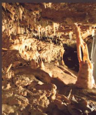
Pegels en druipstenen