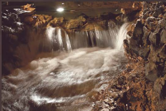
Waterval van de ondergrondse rivier

De ondergrondse rivier bewerkt eindeloos de rots en biedt zo een schitterend aanzicht.