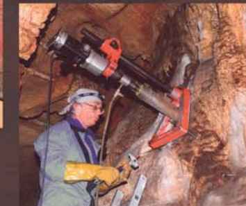
Kernboring voor datering

Gedreven door dezelfde passie om het verleden en onze natuurlijke omgeving te begrijpen verkennen speleologen en onderzoekers onafgebroken de grotten.