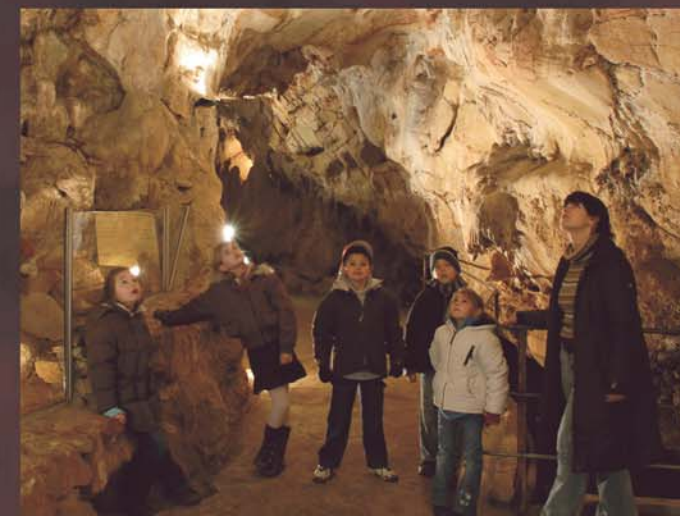
Rondleiding van een klas